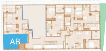
PLANTA TIPO – UBICACIÓN VIV. "AA" y VIV. "AB"