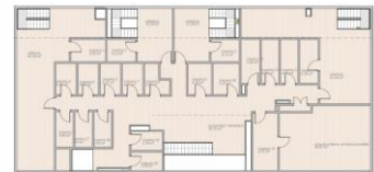
PLANTA 5a – SOLARIUM / TERRAZA+TRASTEROS