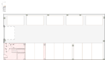
PLANTA BAJA – PLAZAS PARKING VIVIENDAS